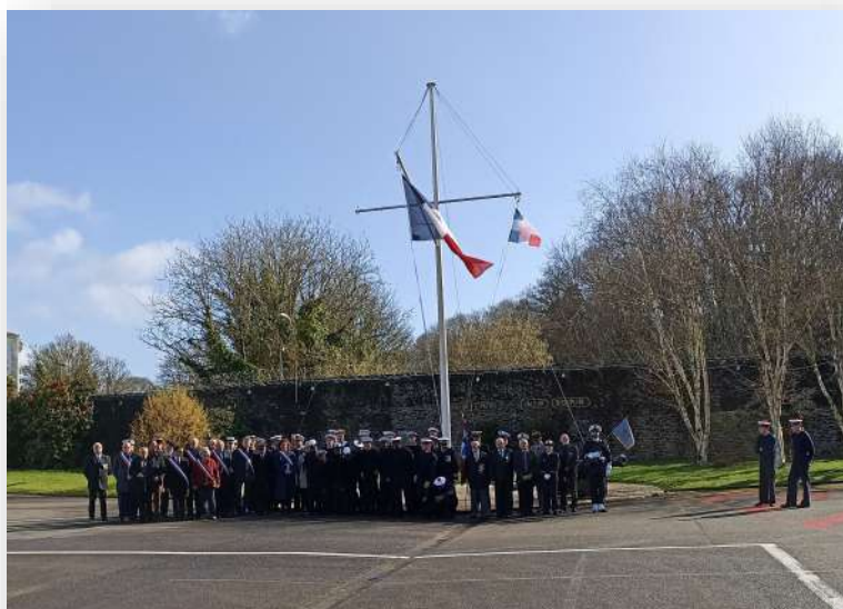
L'ensemble des volontaires

À l'issue de cette cérémonie clôturée par le défilé des volontaires et le rafraîchissement, la délégation a remercié le commandant et le commandant en second pour l'invitation et l'accueil du personnel de cette unité.