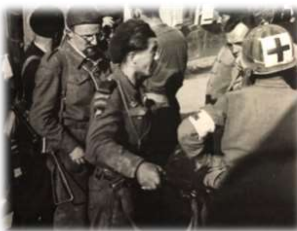
Parachutistes français en discussion avec des infirmiers américains.

La vengeance ne s'est pas fait attendre : les troupes américaines ont encerclé les Allemands dans le village et les ont pris dans leur fuite, qu'ils soient à pied ou dans des carrioles à cheval, les bombardant d'obus. Sur les 1.500 Allemands qui étaient entrés dans Plouvien, seuls 700 ont pu en ressortir debout. »