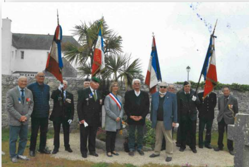
Les anciens combattants présents entourant Madame le Maire